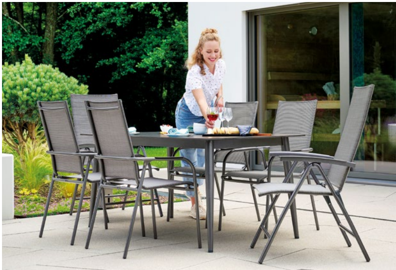
Die pflegeleichten und wetterfesten „Sirio“-Sessel gehören zur Sieger Exclusiv-Kollektion und passen hervorragend zu den neuen „Loft“-Tischen des Sieger Tischfreiheit-Programms.

Einen attraktiven und komfortablen Sitzplatz unter freiem Himmel verspricht Sieger mit dem „Sirio“-Sessel. | Neue Programme