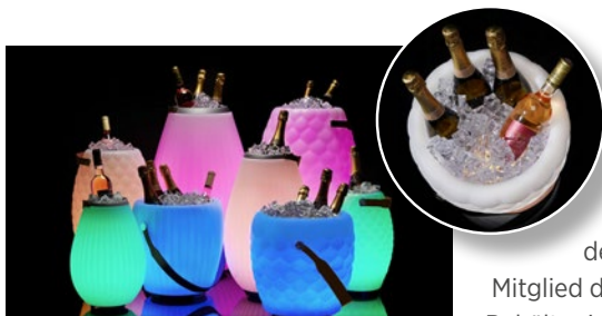
„The Jooouly“ ist ab sofort in acht Varianten erhältlich, u. a. in der neuen „Jooouly Bowl“.