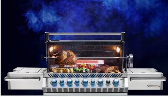
Grillgenuss garantiert der Grill „Napoleon Prestige Pro 665“.