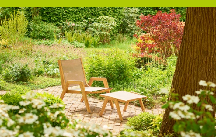
Der „Kate Lazy Lounge chair“ von Traditional Teak.