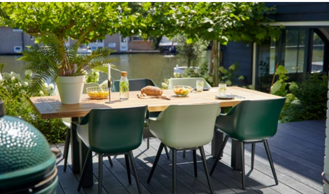
Hartman hat das Sortiment „Sophie“ weiter geschärft.

Die neue „Valencia Gartenlounge“ von Niehoff Garden punktet mit einer puristischen Designoptik. Der reduzierte Look wird durch abgerundete Polster und filigrane Aluminiumfüße erreicht. Die großzügige Sitzfläche ist bequem gepolstert und verfügt über einen haptisch angenehmen Bezugsstoff, der dank wasserabweisender Eigenschaften in besonderem Maße für draußen geeignet ist. Bei „Valencia“ handelt es sich um eine modulare Loungegruppe, die sich dem individuellen Platzbedarf bestens anpasst.