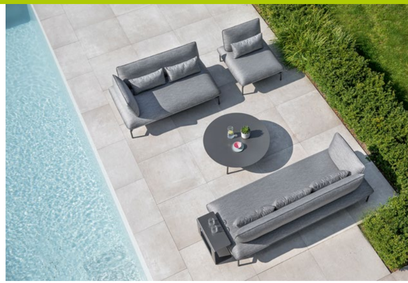
Die modulare Loungegruppe „Valencia“ lässt sich auf den individuellen Platzbedarf anpassen.

Das kanadische Unternehmen Napoleon steht nach eigenen Angaben für innovative Technologien, optimale Leistung und zeitlos elegantes Design. Dies spiegelt sich auch im Grill „Napoleon Prestige Pro 665“ wieder. Schon auf den ersten Blick fallen die Chrom-Akzente entlang des Grilldeckels und dem seitlich integrierten Gewürz- und Handtuchhalter ins Auge. Auf der einladenden Grillfläche mit extrem dicken „Wave“ Edelstahl-Stabgrillrosten lassen sich bis zu 42 Burger gleichzeitig grillen. Der leistungsstarke, ultraheiße Infrarot „Sizzle Zone“ Seitenbrenner ist hingegen Garant für saftige Steaks.