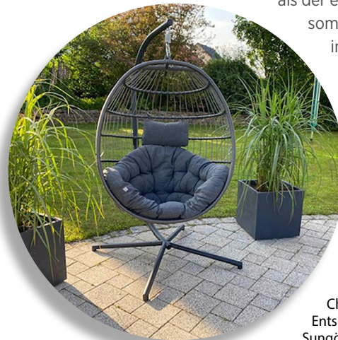
Der faltbare Hängekorb „Meran“ von Sungörl lädt zum Chillen, Relaxen und Entspannen ein.

Seit zwei Jahren bietet Sungörl mit seinem faltbaren Hängekörben ein Segment zum Chillen, Relaxen und Entspannen an. Für alle, die auch wenig Platz zur Verfügung haben, sind die Hängekörbe von Sungörl „ein echter Problemlöser“. Zusammengefaltet mit dem sehr stabilen und nur mit fünf Schrauben zu montierenden Stahlgestell und einem bequemen Kissen mit Kopfteil, passt alles in einen Karton. Dieser Karton ist nicht größer als der eines Faltrades und somit kann alles auch im Winter platzsparend aufgeräumt werden.