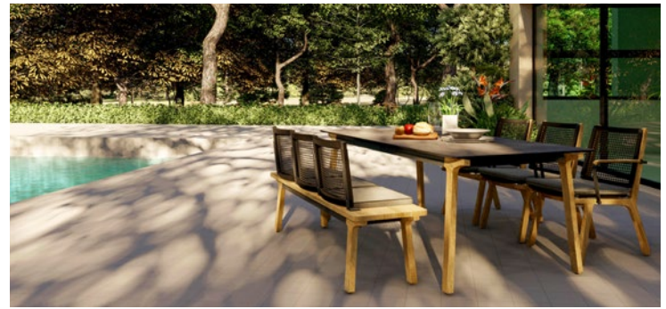
„Lenyx“ heißt die neue Serie der „Zebra pure“-Kollektion.