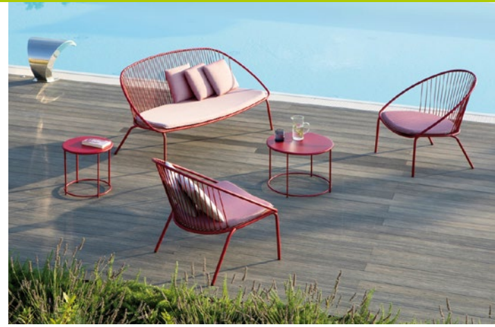
Die Loungemöbel „Aria“ von Vermobil.

Ob auf dem Balkon, der kleinen Terrasse, im Patio oder auf einer Penthouse-Dachterasse, die „Urban Dining Lounge“ von Solpuri ist für alle urbanen Outdoor-Bereiche konzipiert und bietet mit ihrem praktischen Mix aus Lounging und Dining gleich zwei Funktionen. Das filigrane Rundrohrgestell, mit einer zweifarbigen Flachschnurwicklung, trägt komfortable Sitzkissen und jede Menge weicher Wurfkissen im Rücken, die mit ihrer Zweifarbigkeit die moderne Lässigkeit des Designs unterstreichen. Die modulare Dining-Lounge besteht aus nur drei kombinierbaren Elementen. Mit diesen lassen sich unzählige Anordnungen realisieren: von der schlichten Bank, die sich auf dem Balkon von Wand zu Geländer einpasst, über die lange seitlich geschlossene Bank bis hin zu einer Eckbank.