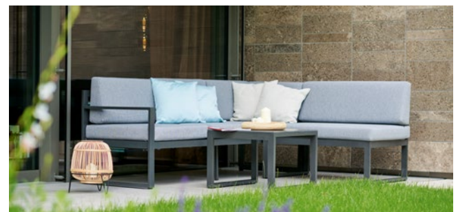
Komfortables Sitzvergnügen bietet die Eck-Lounge „Adelaide“.

Die Eck-Lounge „Adelaide“ von Sieger verbindet puristisches Design und dezente Farbgebung mit komfortablem Sitzvergnügen. Zur hochwertigen Lounge gehören eine 1,5- und eine 3-Sitzer-Bank mit einer zur Rückenlehne 5-fach verstellbaren Sitzfläche auf einer Seite sowie ein Hocker. Je nach Wahl des Tisches wird „Adelaide“ zur bequemen Eck-Lounge zum Relaxen oder in Kombination mit Hockern und dem neuen Sieger Dining-Tisch zum Essplatz für sechs Personen.