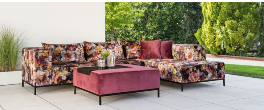
Das Jubiläumsdesign „Flower“ ist eines der optischen Highlights der Jubiläums-kollektion von Stern.

Seit 75 Jahren feiert Stern das Leben im Freien und nimmt das Firmenjubiläum zum Anlass, um eine völlig neue, eigenständige Jubiläums-Kollektion zu präsentieren. Losgelöst von den zahlreichen Neuheiten für die Saison 2023, bietet der Gartenmöbel-Spezialist exklusive Produkte, die sich nochmals stärker auf außergewöhnliches Design, Formensprache und besondere Details konzentrieren. Zur gardiente präsentiert Stern erstmals den neuen Markenauftritt. „Wir freuen uns darauf, bei der gardiente zum ersten Mal wieder zeigen zu können, dass wir in der messefreien Zeit nicht untätig waren und uns konsequent weiterentwickelt haben“, so Jürgen Frank Brackmann, Geschäftsführer von Stern.