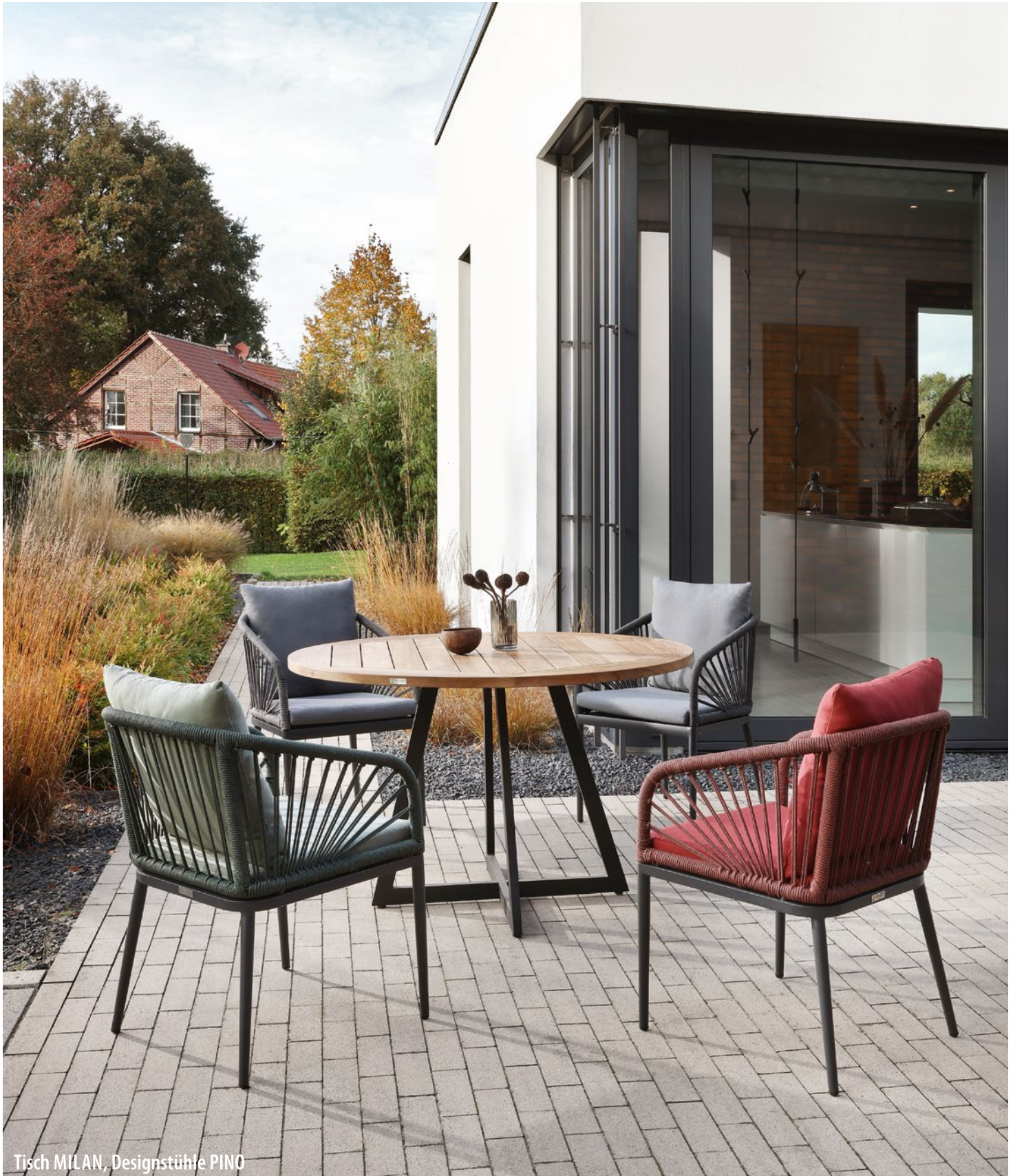
Tisch MILAN, Designstühle PINO