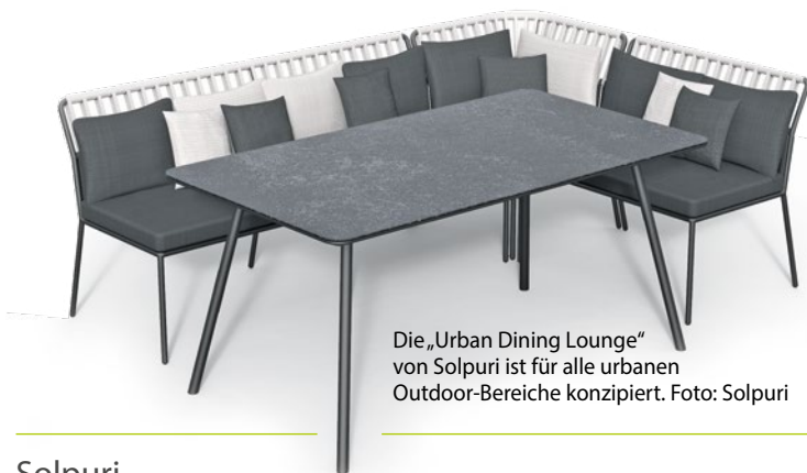
Die „Urban Dining Lounge“ von Solpuri ist für alle urbanen Outdoor-Bereiche konzipiert.